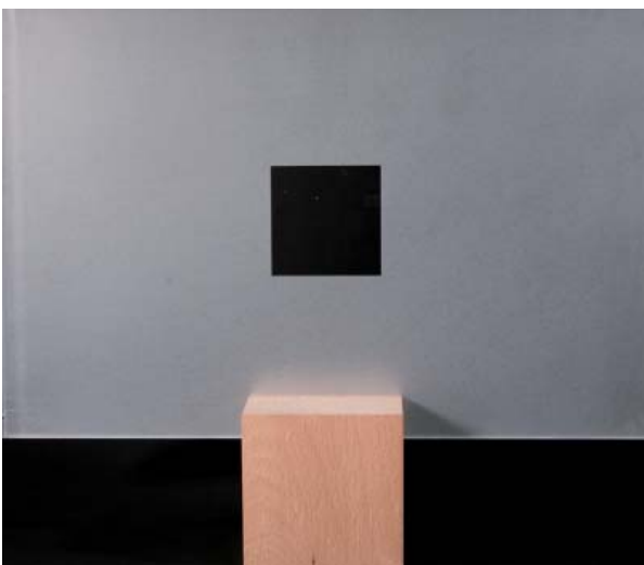
Mit PROVETRO-Griffschutz With PROVETRO Sandblasted surface protector