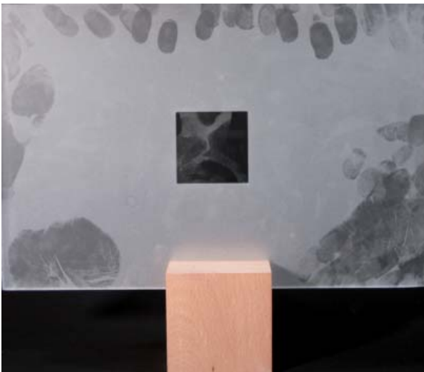
Ohne PROVETRO-Griffschutz Without PROVETRO Sandblasted surface protector