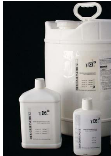
49 002 00 - 49 019 00 PROVETRO Griffschutz Sandblasted surface protector