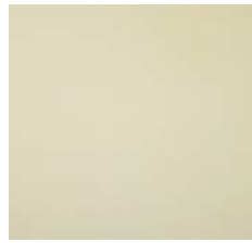
49 051 02 NANO Decoration Gelb / yellow, 100 g