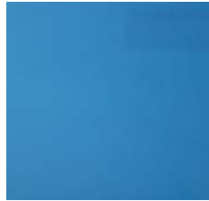
49 051 07 NANO Decoration leuchtend Blau / bright blue, 100 g