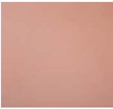
49 051 00 NANO Decoration Orangerot / orange red, 100 g