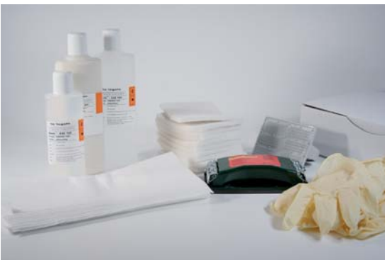
49 061 50 Glasbeschichtungsset für Klarglas Nano-CLE 301, Vorreiniger für klares Glas, 650 g Beschichtungsmaterial, 200 g Nano-CLE 100, Nachreiniger, 400 g 10 Stück Reinigungspad, Handgriff für Reinigungspad 10 Einweghandschuhe, 10 Poliertücher, Handgriff für Poliertuch, Dokumentation

Coating set for clear glass Nano-CLE 301, Precleaner for clear glass, 650 g Nano-E2C 105, Coating material for clear glass, 200 g Nano-CLE 100, Finishing cleaner for clear glass, 400 g 10 pcs. Cleaning pad, Pad handle, 10 One way latex glove, 10 polishing cloth, Handle for polishing cloth Documentation