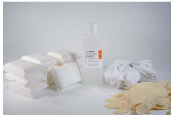
49 041 50 Glasbeschichtungsset für Mattglas Nano-E2C 113, Beschichtungsmaterial für Mattglas, 400 g 4 Stück Polierhauben, 10 Einweghandschuhe, 10 Auftragsschwämme (Microfaser) Dokumentation

Coating set for clear glass Nano-CLE 301, Precleaner for clear glass, 650 g Nano-E2C 105, Coating material for clear glass, 200 g Nano-CLE 100, Finishing cleaner for clear glass, 400 g 10 pcs. Cleaning pad, Pad handle, 10 One way latex glove, 10 polishing cloth, Handle for polishing cloth Documentation