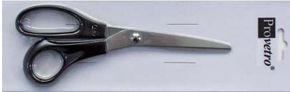
36 205 00 PROVETRO Schablonschere für Folie PROVETRO pattern shears for foil