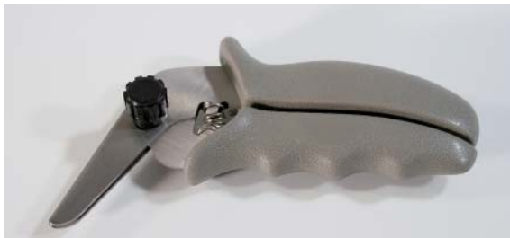
36 210 10 INLAND Bleischere für Schablonenherstellung INLAND pattern shears for lead