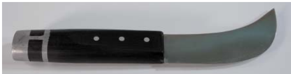
36 310 00 Bleimesser mit Bleianguß Lead knife with lead end