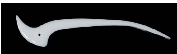
36 155 00 Bleiaufreiber und Andrücker, Kunststoff Lead burnisher, plastic