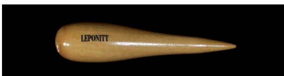
36 156 00 Bleiaufreiber aus Holz Lead burnisher, wooden