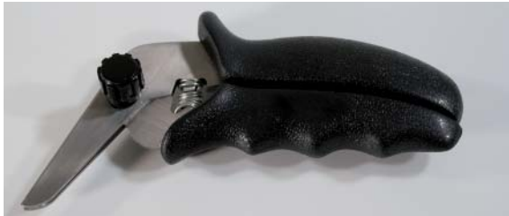
36 205 10 INLAND Folienschere für Schablonenherstellung INLAND pattern shears for foil