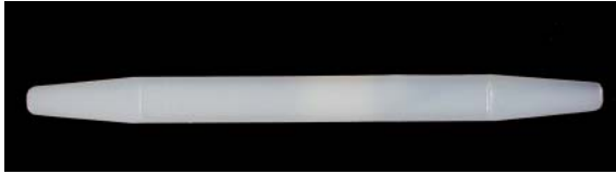
36 160 00 Falzbein, Kunststoff Burnisher, plastic