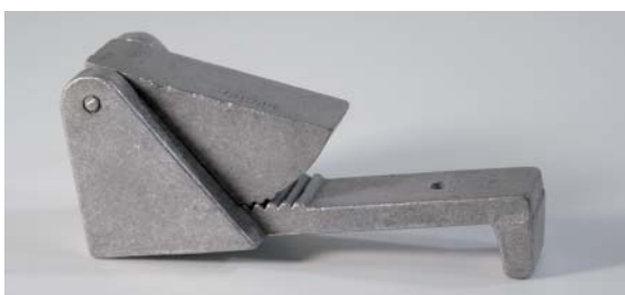
36 300 00 Blei-Strecker / Aluminium, mit Feder Lead stretcher / aluminum, with spring