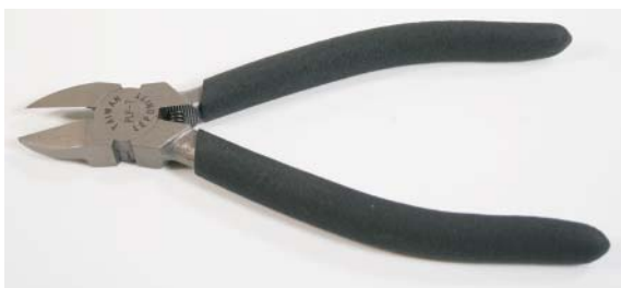
32 170 00 Blei-Seitenschneider Lead came cutter