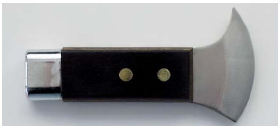
36 305 00 CORTELLO SLK 2 Bleimesser mit Trennklinge CORTELLO SLK 2 lead knife with separating blade