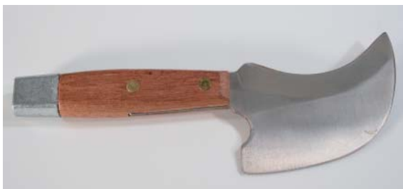
36 305 20 CORTELLO SLK 3 Maxi Bleimesser mit ¼ Kreis-Klinge CORTELLO SLK 3 Maxi lead knife with ¼ circle blade