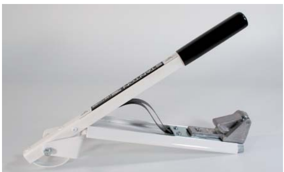
36 301 00 GLASTAR Blei-Strecker GLASTAR lead stretcher