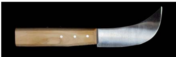
36 306 00 Bleimesser mit Sichel-Klinge Lead knife with banana blade