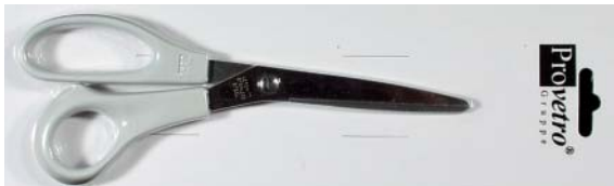
36 210 00 PROVETRO Schablonschere für Blei PROVETRO pattern shears for lead