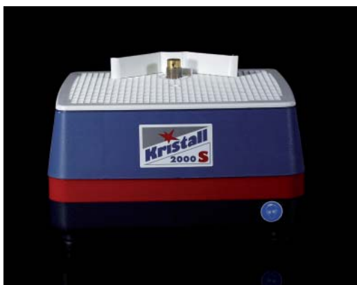
30 101 50 KRISTALL 2000S (Powermotor) 280 x 235 mm Arbeitsfläche, 100 W, 2800 U/min, Präzisionskugellager, eingebaute Schleifwasserpumpe, Thermoschutz, Spritzschutz, 19 mm Schleifkopf

280 x 235 mm work surface, 100 W 2225 rpm, dual precision ball bearings, built in grinding water pump thermal protection, splash guard, 19 mm diamond bit