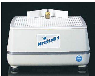
30 102 00 KRISTALL I 280 x 235 mm Arbeitsfläche, 100 W, 2255 U/min, Präzisionskugellager, incl. Thermoschutz, Spritzschutz, 19 mm Schleifkopf

280 x 235 mm work surface, 100 W 2255 rpm, precision ball bearings, thermal protection, splash guard, 19 mm diamond bit