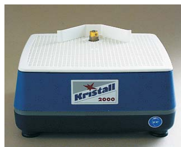
30 101 00 KRISTALL 2000 280 x 235 mm Arbeitsfläche, 100 W, 2225 U/min, Präzisionskugellager, eingebaute Schleifwasserpumpe, incl. Thermoschutz, Spritzschutz, 19 mm Schleifkopf

280 x 235 mm work surface, 100 W, 2800 rpm, precision ball bearings, thermal protection, splash guard, 19 mm diamond bit