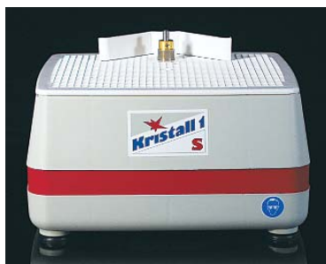
30 102 50 KRISTALL IS (Powermotor) 280 x 235 mm Arbeitsfläche, 100 W, 2800 U/min, Präzisionskugellager, incl. Thermoschutz, Spritzschutz, 19 mm Schleifkopf

280 x 235 mm work surface, 100 W 2255 rpm, precision ball bearings, thermal protection, splash guard, 19 mm diamond bit