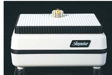
30 117 00 INLAND Impulse 230 x 255 mm Arbeitsfläche (beidseitig verwendbar), 3500 U/min, Thermoschutz, TouchTop - Schalter, 25 und 6 mm Schleifköpfe

230 x 255 mm work surface (double sided), 3450 rpm, thermal protection, 19 mm bit