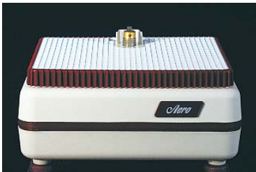
30 116 00 INLAND Aero 230 x 255 mm Arbeitsfläche (beidseitig verwendbar), 3450 U/min, Thermoschutz, TouchTop - Schalter, 19 mm Schleifkopf

230 x 255 mm work surface (double sided), 3450 rpm, thermal protection, TouchTop switch, 19 mm bit