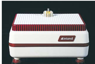
30 120 00 INLAND Contour 230 x 255 mm Arbeitsfläche (beidseitig verwendbar), 3450 U/min, Thermoschutz, 19 mm Schleifkopf

230 x 255 mm work surface (double sided), 3450 rpm, thermal protection, TouchTop switch, 19 mm bit