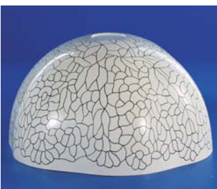
90 329 00 LABURNUM d = 18 cm, 762 Teile / Pieces mit Schnittmuster / with pattern