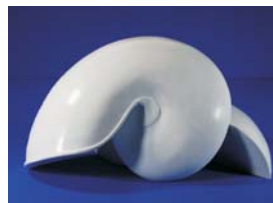
SM22222 Nautilus, Mini, 16 cm mit Schnittmuster with pattern

0A00008 Schnittmuster / Pattern für SM22222