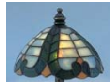
90 304 00 JUGENDSTIL d = 10 cm, 104 Teile / Pieces mit Schnittmuster / with pattern