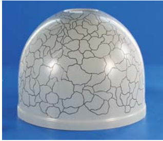
90 316 00 HYDRANGEA d = 20 cm, 348 Teile / Pieces mit Schnittmuster / with pattern