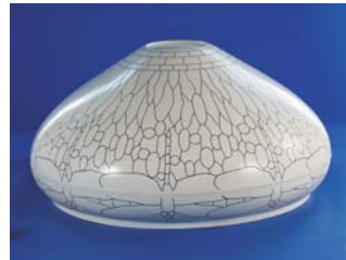
90 311 00 DRAGONFLY d = 28 cm, 639 Teile / Pieces mit Schnittmuster / with pattern