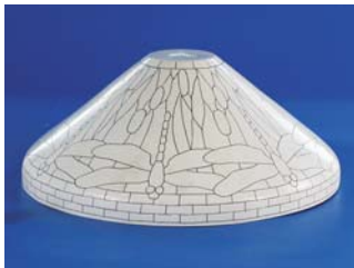
90 312 00 DRAGONFLY d = 25cm, 434 Teile / Pieces mit Schnittmuster / with pattern