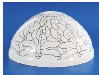
90 322 00 DRAGONFLY DOME d = 11 cm, 252 Teile / Pieces mit Schnittmuster / with pattern