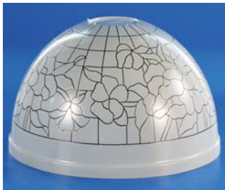
90 320 00 PANSY d = 15 cm, 336 Teile / Pieces mit Schnittmuster / with pattern