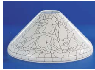
90 315 00 FISH d = 20 cm, 430 Teile / Pieces mit Schnittmuster / with pattern