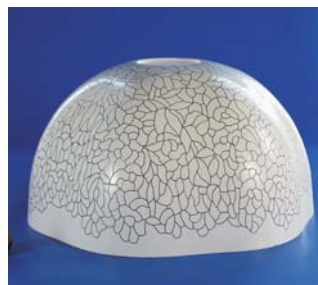
90 317 00 LABURNUM d = 28 cm, 1206 Teile / Pieces mit Schnittmuster / with pattern