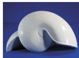
SM33333 Nautilus T, 30 cm mit Schnittmuster with pattern

0A00008 Schnittmuster / Pattern für SM22222