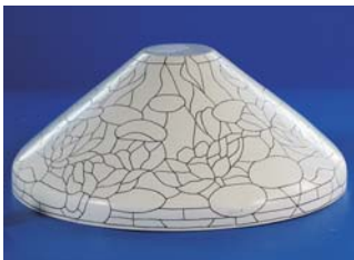
90 310 00 WATERLILY d = 25 cm, 720 Teile / Pieces mit Schnittmuster / with pattern