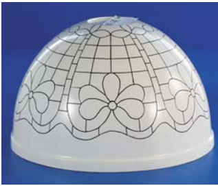
90 321 00 LILIE d = 15 cm, 252 Teile / Pieces mit Schnittmuster / with pattern

90 321 01 Schnittmuster / Pattern 90 321 03 Mugel / Jewels, 6 Stck.