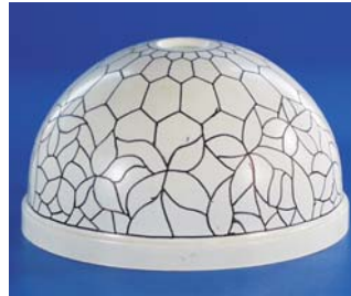
90 307 00 WOODBINE d = 13 cm, 237 Teile / Pieces mit Schnittmuster / with pattern