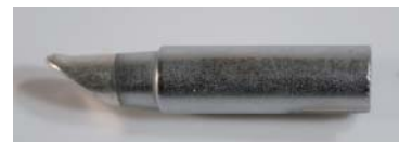
34 200 11 832 GDLF, 55° Lötspitze abgeschrägt, verjüngt Soldering tip offset, tapered