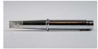
34 105 02 SG 41 Meißel chisel, straight