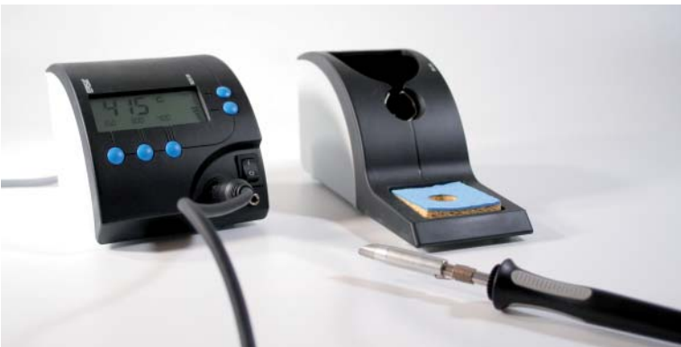
34 222 00 ERSA Digital RDS 80 Lötstation / Digitalanzeige, 150 - 450°C stufenlos, mit Spitze 842 CD ERSA Digital RDS 80 soldering station / Digital display, 150 - 450°C continuously adjustable, with tip 842 CD