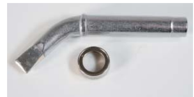
34 110 04 SG 53 Meißel, gebogen chisel tip, curved