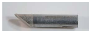
34 200 13 832 LDLF, 35° Lötspitze abgeschrägt, breit Soldering tip offset, wide