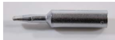
34 200 05 832 ED Lötspitze, Meißel, spitz Soldering tip pointed,