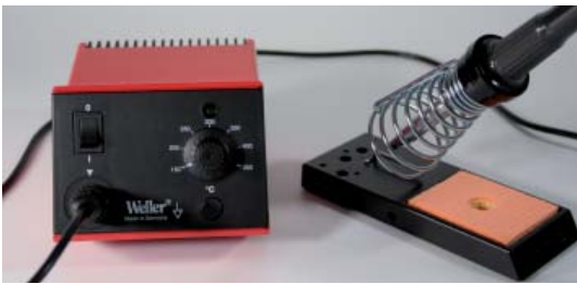
34 195 00 WELLER Lötstation WHS80, 95 W, mit LötKolben LR21 Soldering station WHS 80, 95 W, soldering iron LR21

LÖTSTATIONEN sind nicht nur aufgrund des geringen Gewichtes der verwendeten LötKolben bei Profis sehr beliebt. Sie zeichnen sich auch durch sehr kurze Aufheizzeiten aus.