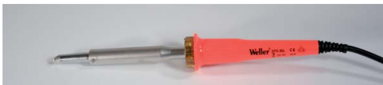
34 101 00 WELLER Hobbykit 2, 80 W, mit Lötspitze SG 10 80 W, with soldering tip SG 10