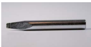
34 101 02 SG 11 Meißel chisel