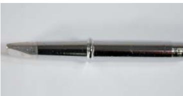
34 110 03 SG 52 Meißel, gerade chisel, straight