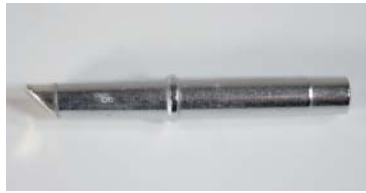
34 105 01 SG 40 abgeflacht flattened