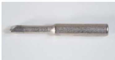
34 101 03 SG 12 verjüngt tapered