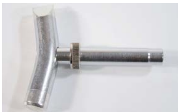
34 110 01 SG 50 Kuppe/Meißel cone/chisel