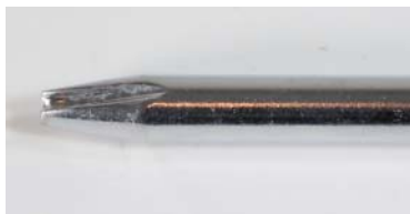
34 101 04 SG 13 mit Rille grooved