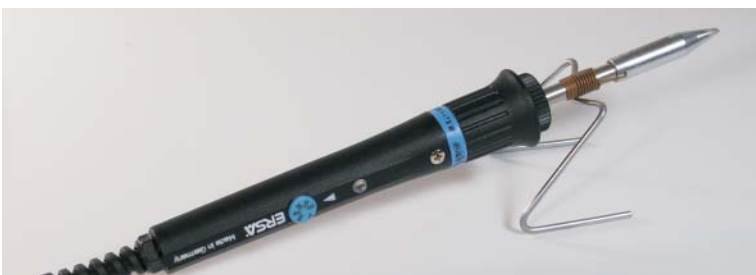
34 201 00 ERSA LötKolben Multi-TC 0760, temperaturgeregelt, mit Spitze 832 VD ERSA Soldering iron Multi-TC, temperature-controlled, with tip 832 VD