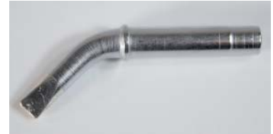
34 105 05 SG 43 gebogen chisel tip, curved