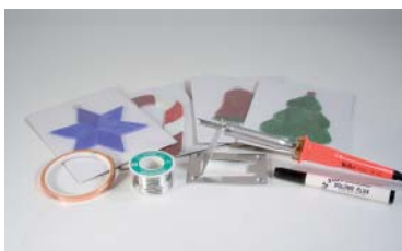
34 120 00 WELLER Tiffany Einsteiger Set, 220 V / 80 W Stained glass kit, 220 V / 80 W