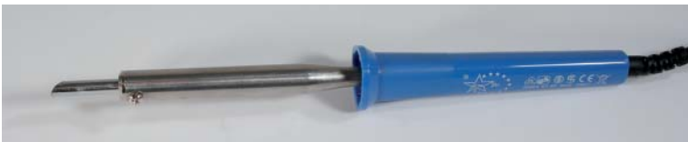
34 900 00 LötKolben mit Dauerlötspitze und Ablage, 80 Watt Soldering iron, durable tip and stand, 80 Watt