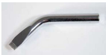
34 101 05 S 39 gebogen chisel tip, curved