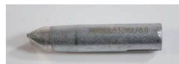
34 200 12 832 MDLF Lötspitze, Meißel groß Soldering tip, chisel, large