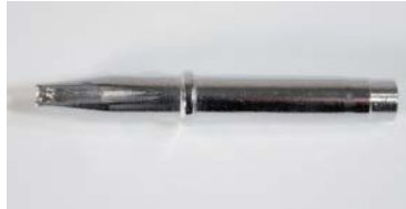
34 105 04 SG 42 mit Rille grooved