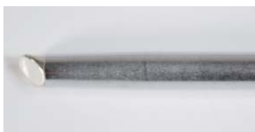
34 101 01 SG 10 abgeflacht flattened