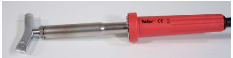
34 110 00 WELLER Profikit 200 (Spitze / tip Nr. 6 - 425°C) 200 Watt, temperaturgeregelt, mit Lötpitze SG 50 200 Watt, temperature controlled / soldering tip SG