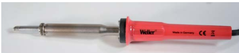
34 105 00 WELLER Profikit 100 W (370°C) temperaturgeregelt, mit Lötspitze SG 40 temperature controlled, soldering tip SG 40