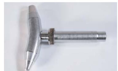
34 110 02 SG 51 Kuppe/Kuppe cone/cone